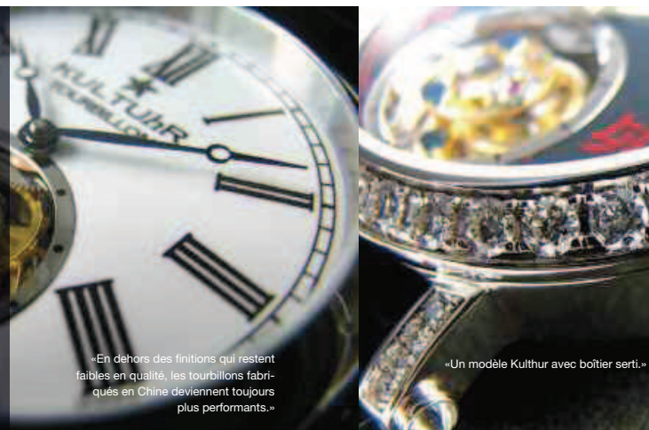
«En dehors des finitions qui restent faibles en qualité, les tourbillons fabriqués en Chine deviennent toujours plus performants.»

Plus besoin d'être millionnaire pour posséder un tourbillon! Si l'on accepte de faire l'impasse sur les produits suisses souvent inabordables, les amateurs disposent aujourd'hui de modèles chinois et italiens à des prix imbattables. Eclairage sur la démocratisation de l'horlogerie compliquée.