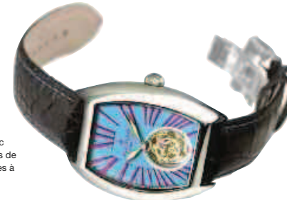
«Les deux marques de Marc Rogivue offrent des palettes de couleurs souvent détonantes à l'instar de ce modèle.»